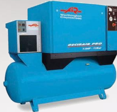
Compresseur à pistons professionnel insonorisé DECIBAIR SNXPRO 7500 T