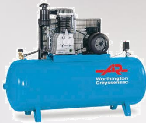
Compresseur à pistons professionnel PIXAIR DNXPRO 7500

Besoin : 25 à 30 m 3 /h Pression : 8 à 10 bar