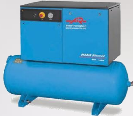
Compresseur à pistons professionnel insonorisé PIXAIR SXR 8500

Besoin : 25 à 30 m 3 /h Pression : 8 à 10 bar