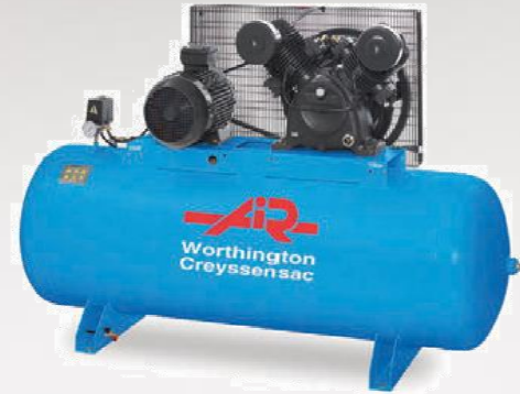
Compresseur à pistons professionnel PIXAIR PXR 8500